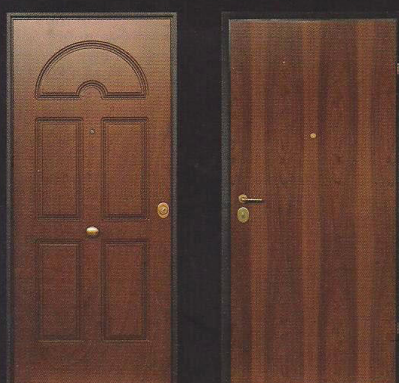
Porta blindata modello K1 Pannello esterno: Mod. Siena, Noce medio - Interno: Noce Nazionale